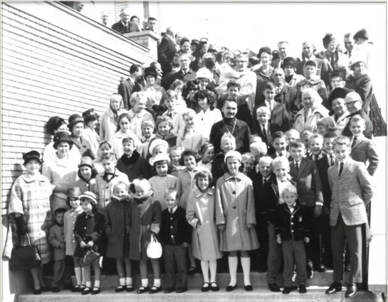
Наша громада в 1964 році

24 березня – в Неділю Торжества Православ'я після Св. Літургії під час Співдружжя.